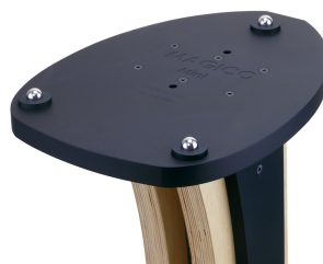
台座 + ボールベアリング